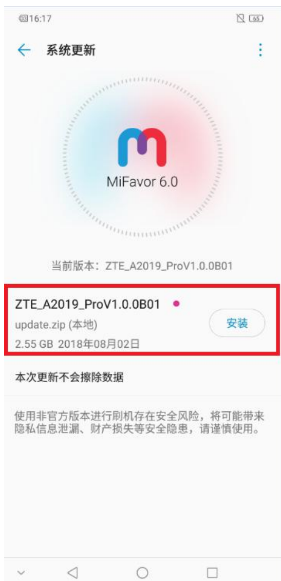
图 3-1 SDCardUpdate 界面