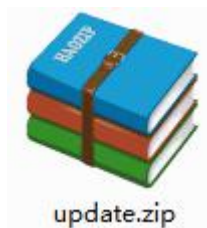
图 2-1 update.zip